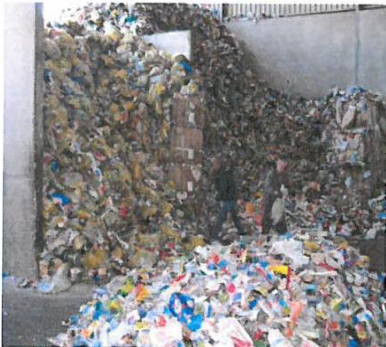
Ouverture manuelle des sacs jaunes

Cette baisse est en partie liée aux incidences du PLPD et à la gestion des déchèteries, notamment à leur utilisation par les professionnels.